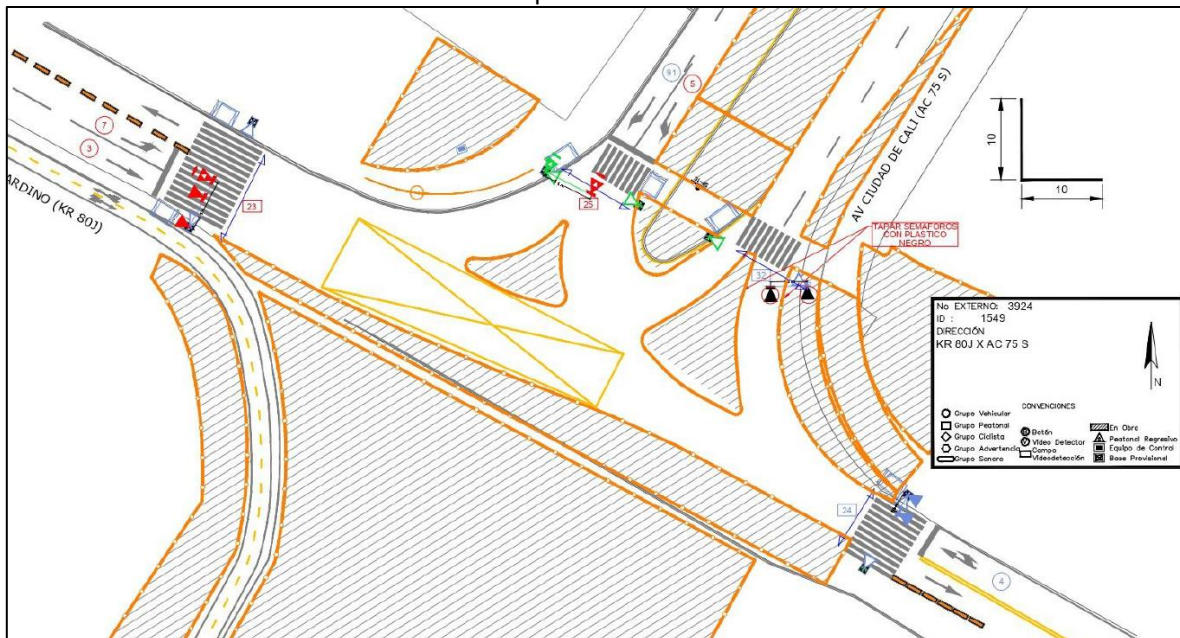
TABLA 1. Movimientos regulados KR 80J X AC 75 S