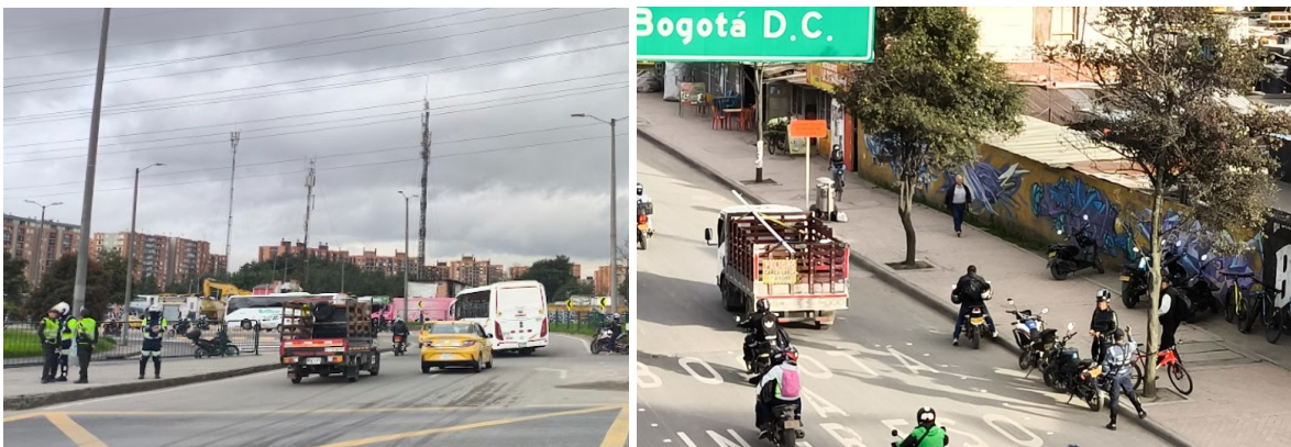
Ilustración No Implementación de acciones operativas sobre el corredor de la Avenida Calle 80

Estas acciones contribuyen de manera significativa a la mejora de la movilidad sobre la autopista Bogotá–Medellín, particularmente en el tramo comprendido entre el Puente de Guadua y el Puente de Siberia, ya que al facilitar el ingreso a la ciudad se optimizan los retornos en sentido occidente–oriente y, a su vez, se mejora la salida del Distrito hacia el occidente.