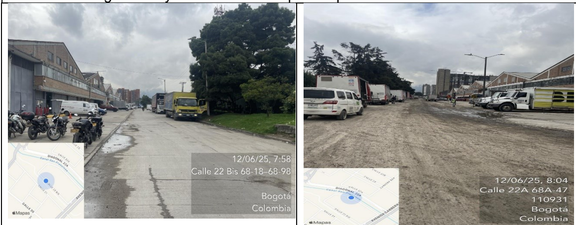
Fotografías 3 y 4. Vías aledañas para el paso de vehículos de obra

Por último, se informa que la SDM mediante oficio SPMT- 202531207747081 da traslado al requerimiento de la referencia, a la Secretaría Distrital de Ambiente para que dentro de sus competencias se atienda lo referente y se dé respuesta por medio de Bogotá te escucha , con copia a esta Entidad a las peticiones que se incluyen en el radicado SDQS-2716632025, teniendo en cuenta lo establecido en el Decreto 109 de 2009, modificado por el Decreto 175 de 2009, el cual preceptúa: