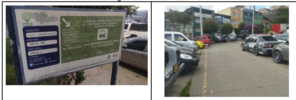
Figura 2. CL 38 SUR 2J 01