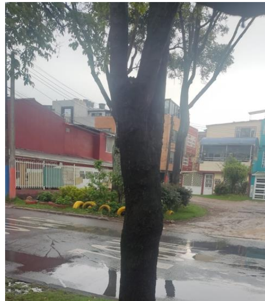
Foto 4. Entrada 2 Parque Muzu 2 Kr 52