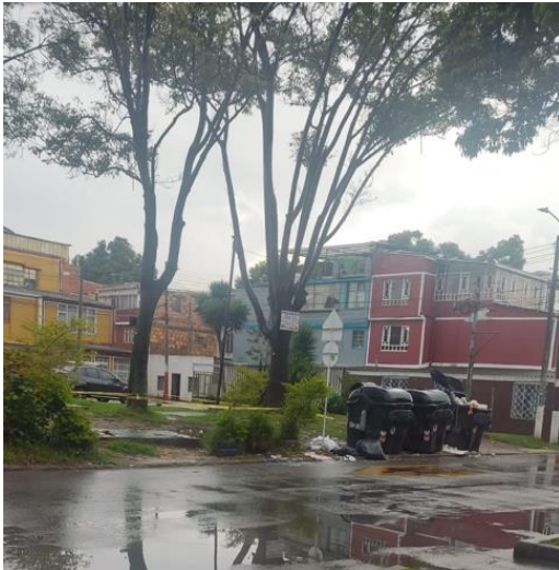
Foto 1. Entrada 1 Parque Muzu 2 Kr 52