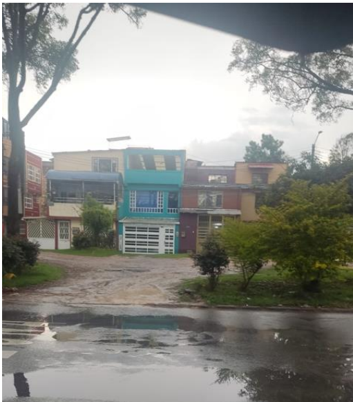
Foto 3. Entrada 2 Parque Muzu 2 Kr 52