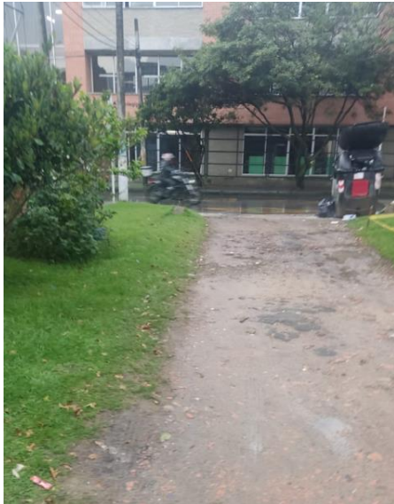
Foto 11. deterioro Parque Muzu