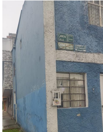
Foto 12. Nomenclatura Esquina.