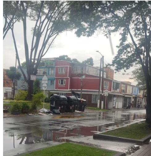
Foto 2. Entrada 1 Parque Muzu 2 Kr 52