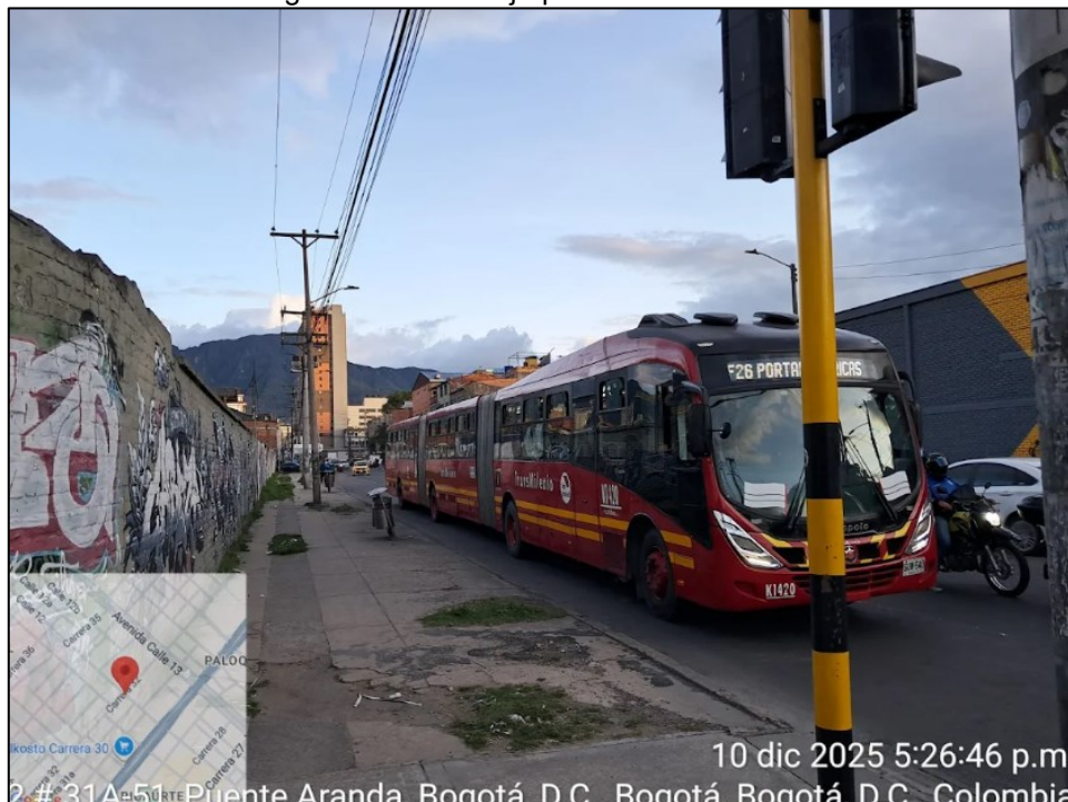
Fotografía 1. Grupo 4 sobre la Calle 12 con asignación de luz roja para el semáforo vehicular