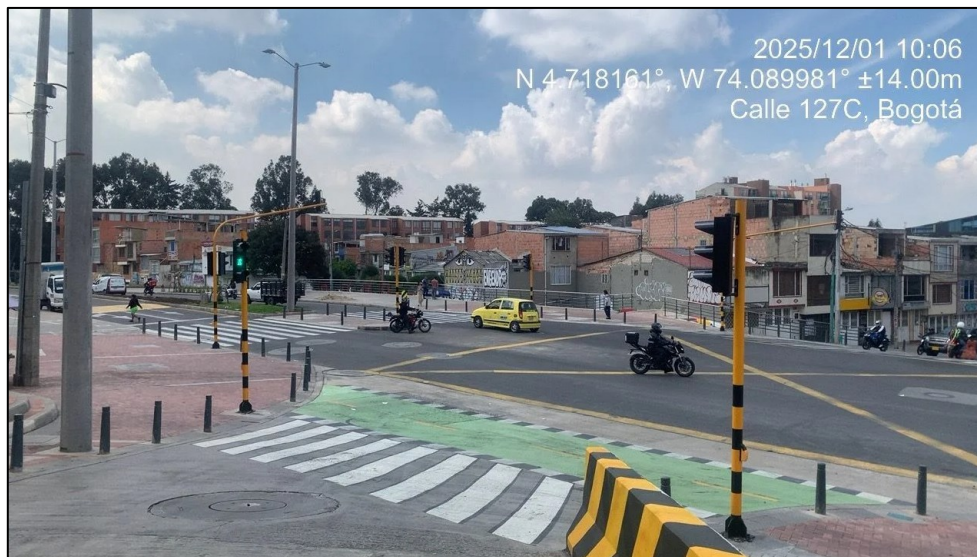
Foto 1. Mobiliario semafórico costado norte.

Por lo anterior, el día 18 de noviembre se realizaron ajustes al planeamiento por cambios de PMT, el cual, se apagó el grupo 1 se aumentó el tiempo de verde del grupo 2 como se indican en las Tablas 1 y 2 y se realizó retiro de los semáforos del grupo norte como se muestra en la Foto 1.