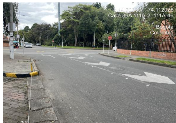
Ilustración No 2: Registro fotográfico de la Calle 86A, en el tramo comprendido entre la carrera 111A y la carrera 111C en el sector Ciudadela Colsubsidio – Bogotá D.C.

Finalmente, resulta pertinente recordar que conforme al Art. 109 de la Ley 769 de 2002 (CNTT), en el cual se establece: “Todos los usuarios de las vías están obligados a obedecer las señales de tránsito de acuerdo con lo previsto en el artículo 5° de este código” se infiere que, aun cuando es responsabilidad de la Secretaría Distrital de Movilidad adoptar todas las medidas necesarias para garantizar la movilidad en condiciones de seguridad y comodidad a los usuarios, existe un deber de corresponsabilidad de los ciudadanos en el acatamiento de las normas.