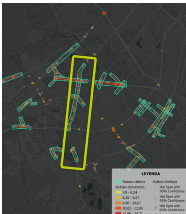
Ilustración 2. Ubicaciones críticas por siniestralidad 2021 - 2024 Bogotá D.C.

Adicionalmente, se identificó que este tramo concentra el 4% de los fallecidos de la ciudad en lo que tiene que ver con siniestros viales, presentando un indicador de siniestralidad de 2.85 fallecidos/Km/año.