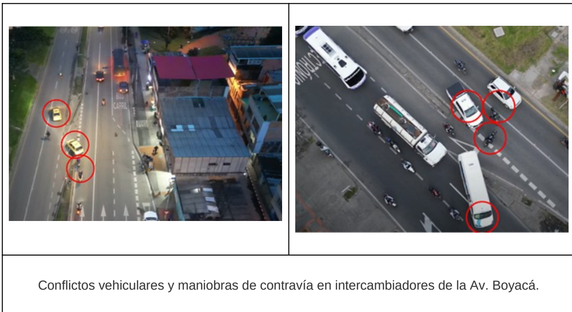
Ilustración 1. Registro de problemáticas en los intercambiadores de la Av. Boyacá

La SDM a través de la Subdirección de Gestión Vía, realizó un seguimiento al tramo de la Avenida Boyacá entre la Carrera 24 y la Avenida Centenario, evidenciando conflictos vehiculares y maniobras de contravía en los diferentes intercambiadores existentes.