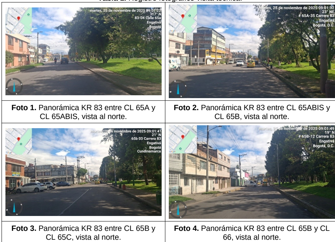
Tabla 1. Registro fotográfico visita técnica.

técnica al sitio indicado el 25 de noviembre de 2025. A continuación, se presenta el registro fotográfico de la visita técnica relacionada.