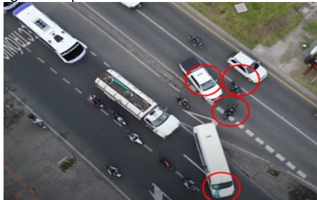
Conflictos vehiculares y maniobras de contravía en Intercambiadores de la Av. Boyacá.