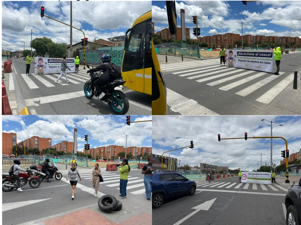
Figura 4. Acciones pedagógicas desarrolladas en la Avenida Ciudad de Cali con Carrera 81.