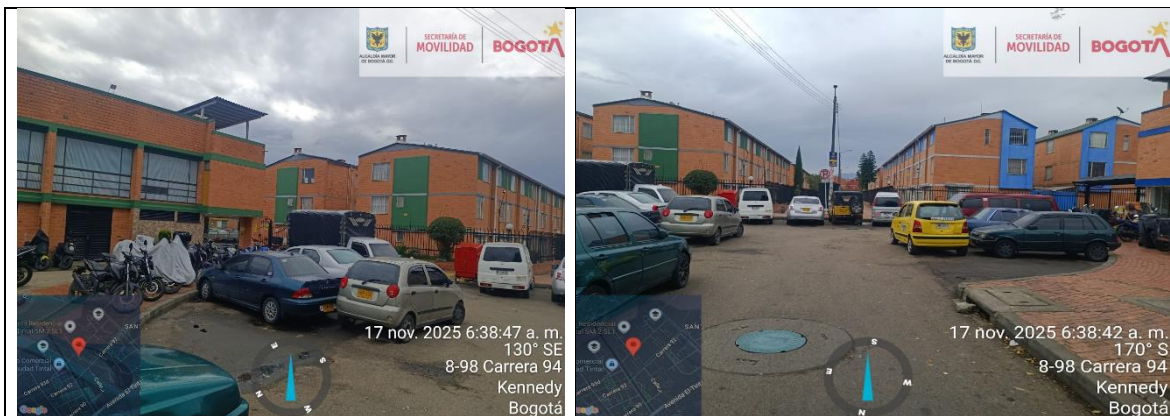
Foto 1. CL 7 con KR 92A. Vista al oriente.

Ahora bien, Atendiendo lo solicitado, se remite la información para el sector de la CL 7 con KR 92A, identificado con Código de Identificación Vial CIV – 8013887, el cual corresponde a una vía de la malla vial local de la ciudad, la SDM realizó visita técnica el 17 de noviembre de 2025. A continuación, se presenta el registro fotográfico, donde se evidencian las condiciones del sector objeto de análisis.