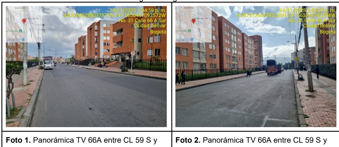
Tabla 1. Registro fotográfico visita técnica.

La SDM informa que, realizó una visita técnica el 14 de noviembre de 2025 al sector de la solicitud. A continuación, se presenta el registro fotográfico de la visita técnica relacionada, donde se identifica el lugar objeto de análisis.