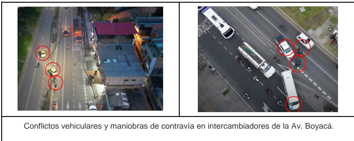
Ilustración 1. Registro de problemáticas en los intercambiadores de la Av. Boyacá

De acuerdo a lo anterior y en atención a su solicitud, la Secretaría Distrital de Movilidad se permite informar que a través de la Subdirección de Gestión Vía, realizó un seguimiento al tramo de la Avenida Boyacá entre la Carrera 24 y la Avenida Centenario, evidenciando conflictos vehiculares y maniobras de contravía en los diferentes intercambiadores existentes.