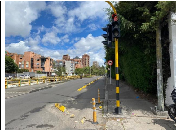
Foto 1. KR 19 con CL 127B, vista al norte.