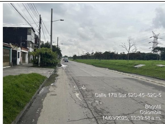
Foto 4. TV 53 a la altura de la CL 19A. Costado occidental. Vista al sur.