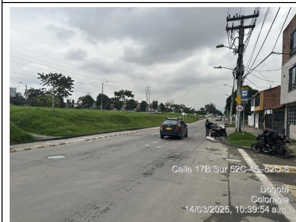
Foto 3. TV 53 a la altura de la CL 19A. Costado occidental. Vista al norte.