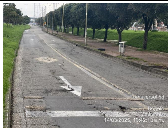
Foto 2. TV 53 a la altura de la CL 19A. Costado oriental. Vista al sur.