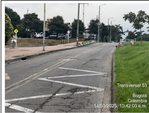
Foto 1. TV 53 a la altura de la CL 19A. Costado oriental. Vista al norte.