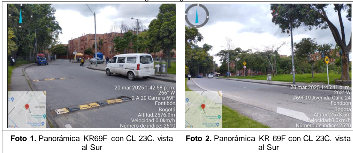
Tabla 1. Registro fotográfico visita técnica.

Adicionalmente, una vez realizada la visita de campo el día 20 de marzo del 2025, se pudo verificar que en el sector del requerimiento se presenta mal estado en la capa de rodadura.