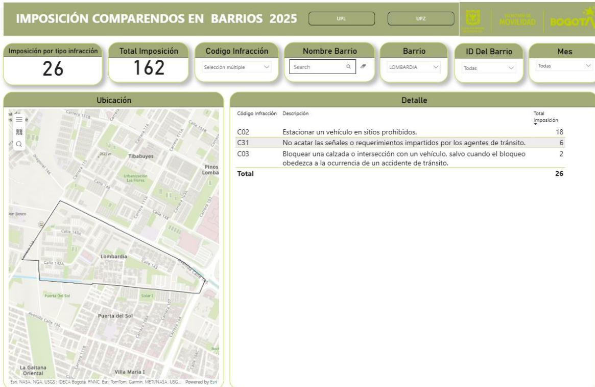
Periodo comprendido del 1 de enero al 31 de octubre de 2025 1

A continuación se presentan los resultados de las infracciones impuestas durante el año 2025 a Vehículos de Transporte Público Individual (Taxis) .