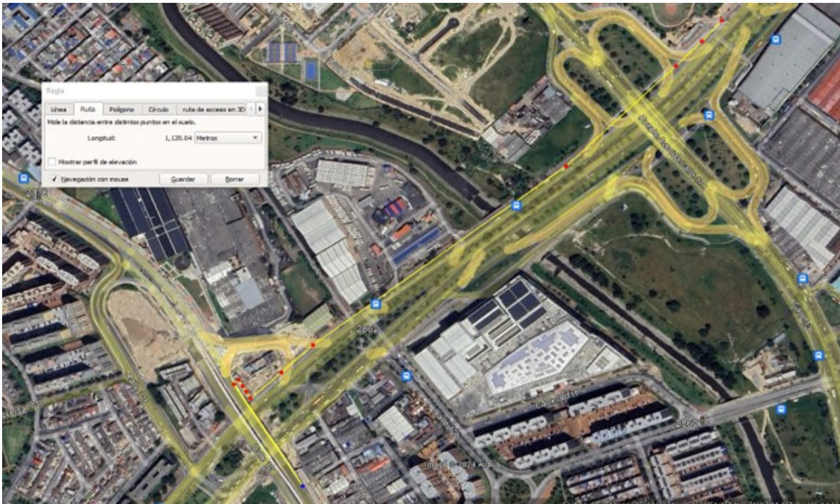
Ilustración 1. Pasos peatonales seguros de conexión entre el costado oriental y occidental de la Avenida Boyacá en la zona aledaña a intersección CL 12B.

1300 metros aproximadamente (medida realizada en https://mapas.bogota.gov.co/# ) como se puede observar en la ilustración 1.