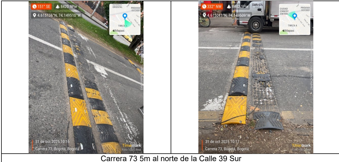
Carrera 73 5m al norte de la Calle 39 Sur