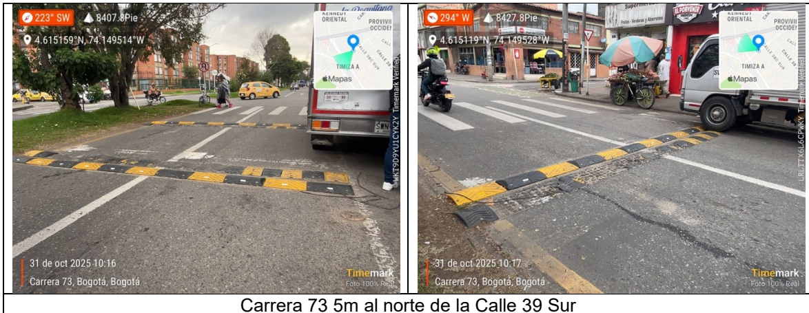
Carrera 73 5m al norte de la Calle 39 Sur