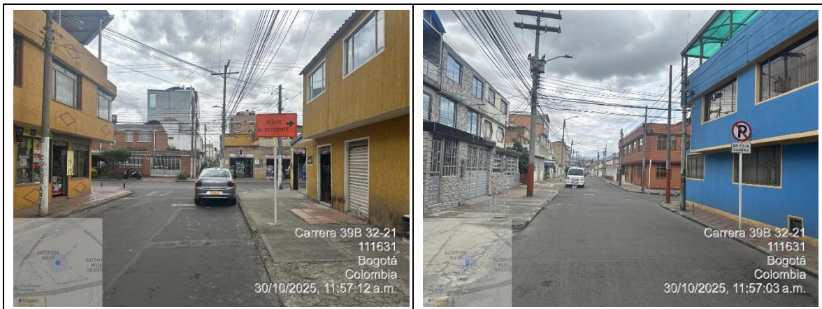
Tabla 1. Registro fotográfico visita técnica.

La SDM realizó una visita técnica al sitio indicado en la solicitud el 30 de octubre de 2025. A continuación, se presenta el registro fotográfico.