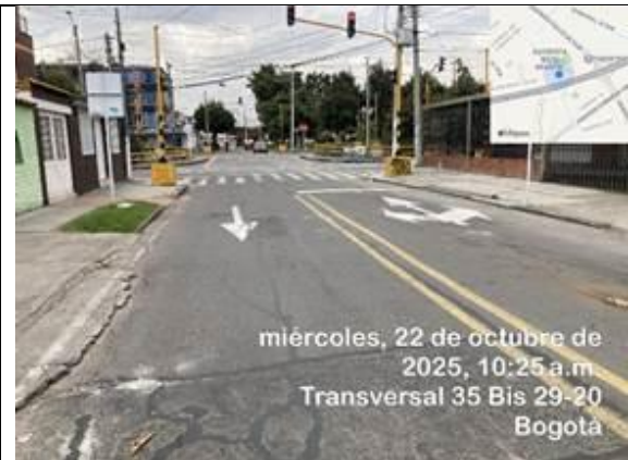
Foto 4: señalización vertical y horizontal en la Transversal 35Bis acceso norte a la Calle 29A sur calzada norte