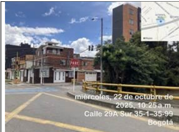
Foto 3: señalización vertical y horizontal Calle 29A sur calzada norte en el acceso oriental a la Transversal 35Bis.

Teniendo en cuenta lo anterior, se informa que el punto indicado en su solicitud cuenta con medidas de mitigación correspondientes a una intersección semaforizada que opera con normalidad, así mismo la señalización en el sector no requiere complemento y/o modificación.