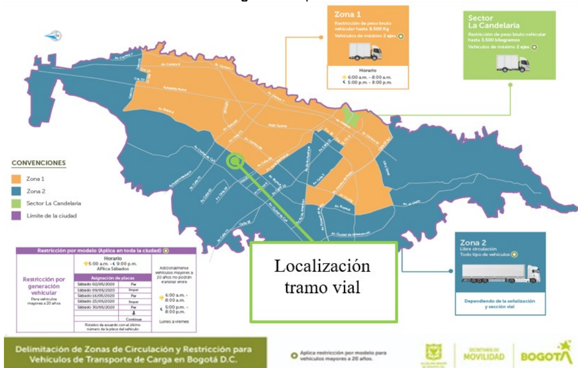
Figura 2. Mapa anexo

La zona se encuentra descrita físicamente en el mapa anexo al presente decreto, del cual forma parte integrante, como Zona Uno (1). (...)