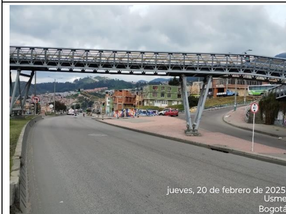
Foto 5. Panorámica CL 91 Sur con KR 5 Este, vista al Norte.