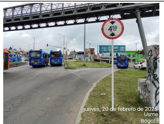
Foto 6. Panorámica CL 91 Sur con KR 5 Este, vista al Sur.