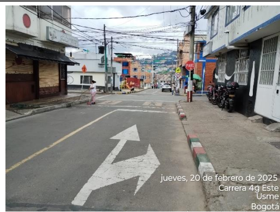
Foto 4. Panorámica CL 97B Sur con KR 4G Este, vista al Norte.