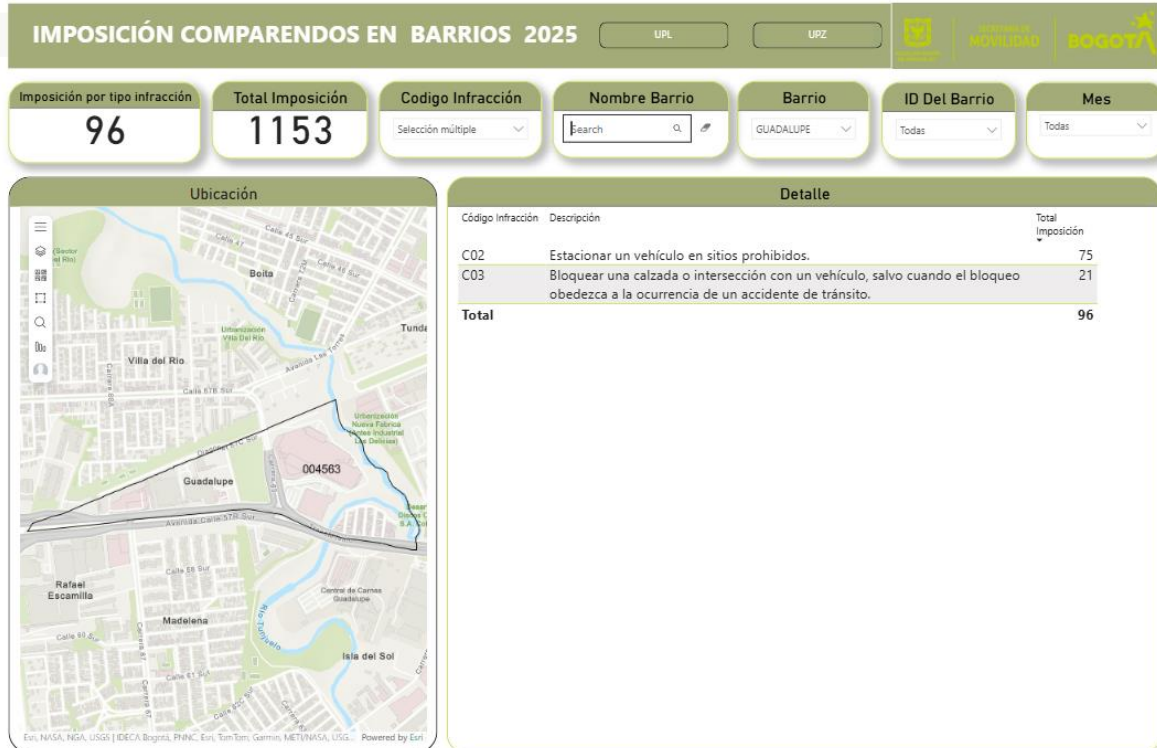
Periodo comprendido del 1 de enero al 30 de septiembre de 2025 1

A continuación se presentan los resultados de las infracciones impuestas durante el año 2025 a Vehículos de Transporte Público Individual (Taxis) .