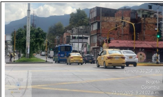
Fotografía 3. Despeje de la carrera 33

De igual manera, se llevó a cabo una visita técnica a la intersección semaforizada ubicada en la Carrera 33 con Avenida Calle 26, la cual corresponde a la intersección semaforizada más cercana a la dirección referenciada en la solicitud. Durante la revisión se verificó que esta intersección opera de manera coordinada con la ubicada en la Carrera 40 con Avenida Calle 26; adicionalmente, se observó que la programación semafórica da prioridad a los movimientos del sistema TransMilenio, tanto en los giros de ingreso como en los de salida hacia la Avenida Calle 26.