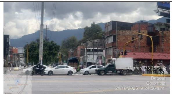
Fotografía 4. Despeje de la Calle 26