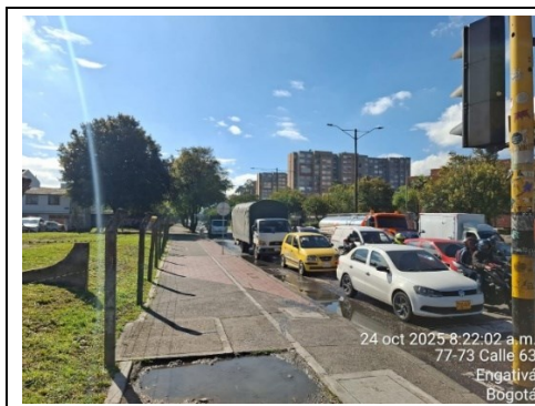
Fotografía 1. Cola en el acceso Oriental.

adecuada para los flujos principales que se desplazan sobre la Calle 63, favoreciendo la continuidad y fluidez vehicular sobre este corredor. Sin embargo, en los accesos Norte y Sur, debido a la existencia de un solo carril de ingreso y otro de salida, se presentan colas de mayor longitud, asociadas a la limitada capacidad vial y a la alta demanda vehicular en determinados periodos del día.