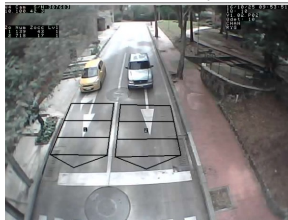
Figura 4. Revisión de video detectores 16 de octubre de 2025