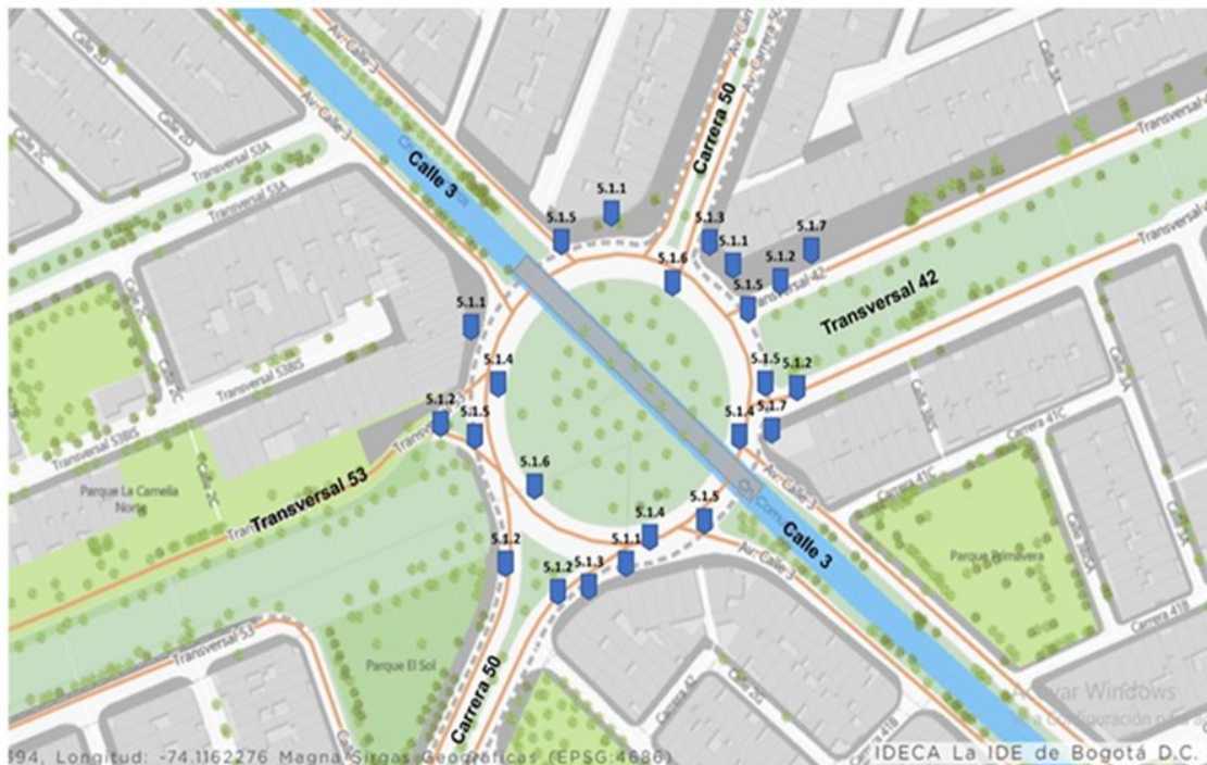
Ilustración 33 Anexo A. Mapa de hallazgos generales