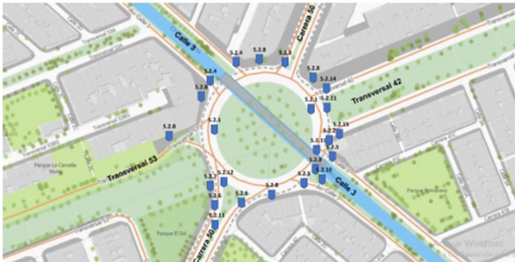
Ilustración 34 Anexo B. Mapa de hallazgos específicos