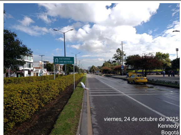
Foto 4. Panorámica KR 71D entre CL 3 y 3 Sur, vista al Norte.