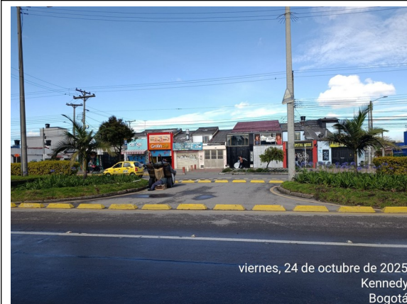
Foto 5. Panorámica KR 71D entre CL 3 y 3 Sur, vista al Occidente.