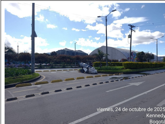
Foto 3. Panorámica KR 71D entre CL 3 y 3 Sur, vista al Oriente.