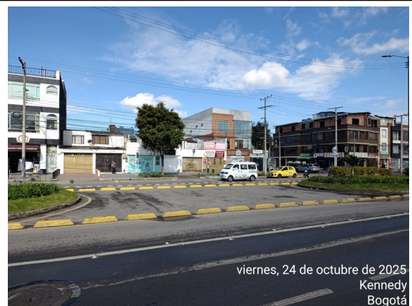
Foto 6. Panorámica KR 71D entre CL 3 y 3 Sur, vista al Occidente.