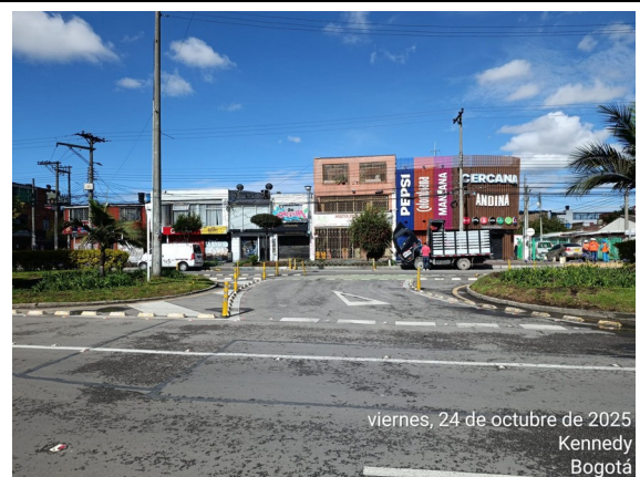
Foto 2. Panorámica KR 71D entre CL 3 y 3 Sur, vista al Occidente.