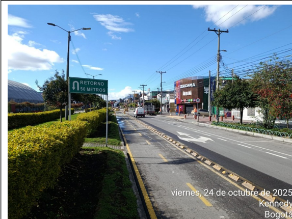
Foto 7. Panorámica KR 71D entre CL 3 y 3 Sur, vista al Sur.