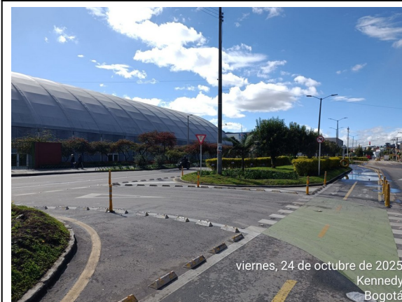
Foto 1. Panorámica KR 71D entre CL 3 y 3 Sur, vista al Sur.