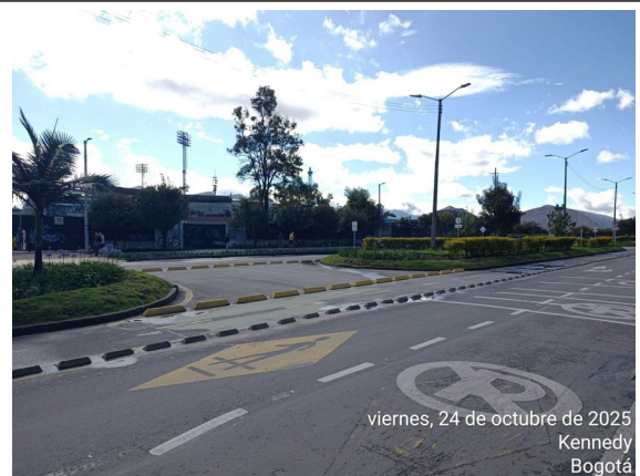
Foto 8. Panorámica KR 71D entre CL 3 y 3 Sur, vista al Oriente.