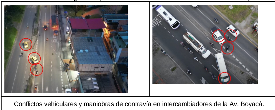
Ilustración 2. Registro de problemáticas en los intercambiadores de la Av. Boyacá

Razón por la cual, la SDM a través de la Subdirección de Gestión en Vía (SDM), realizó un seguimiento al tramo en mención, evidenciando conflictos vehiculares y contravías que afectan directamente la seguridad vial y fluidez del corredor.