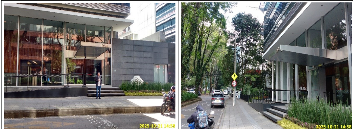
Fotografías No. 1 a 4: Calle 84A No 10 33